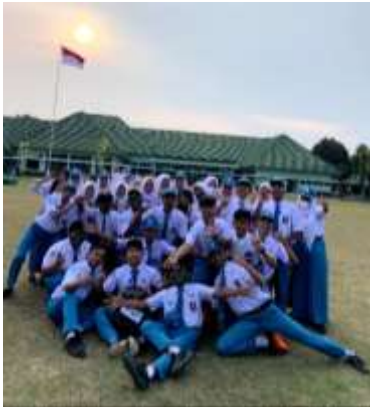
Pelaksanaan P5 di Batalyon Infanteri 521 Markas TNI AD Kota Kediri