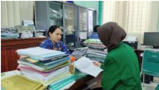
Wawancara dengan Waka Kurikulum