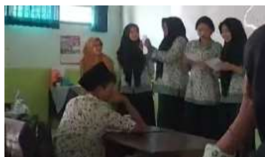
Presentasi kelompok dengan gambar acak