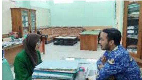
Wawancara dengan Tim Fasilitator P5