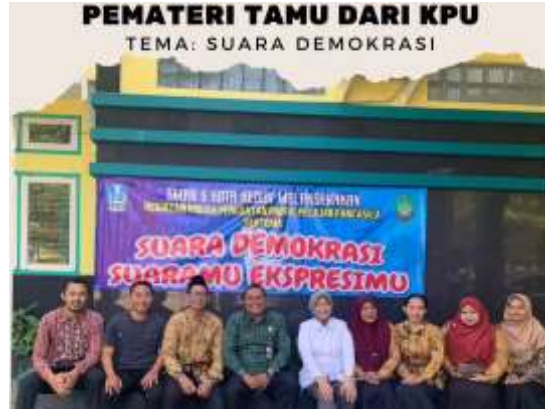
Mengundang Pemateri tamu dari KPU