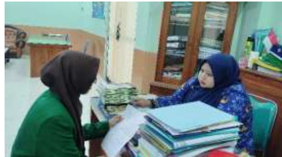
Wawancara dengan Guru Sekolah