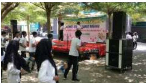
Lomba senam tiap kelas