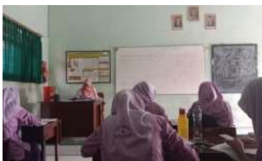
Metode pembelajaran dengan Aplikasi Quiz