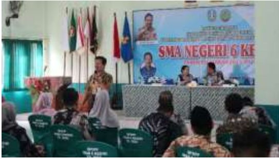
Rapat Perencanaan kurikulum