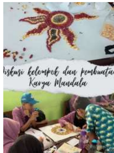
Pembuatan karya Mandala