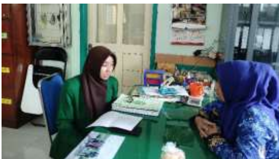
Wawancara dengan Tata Usaha