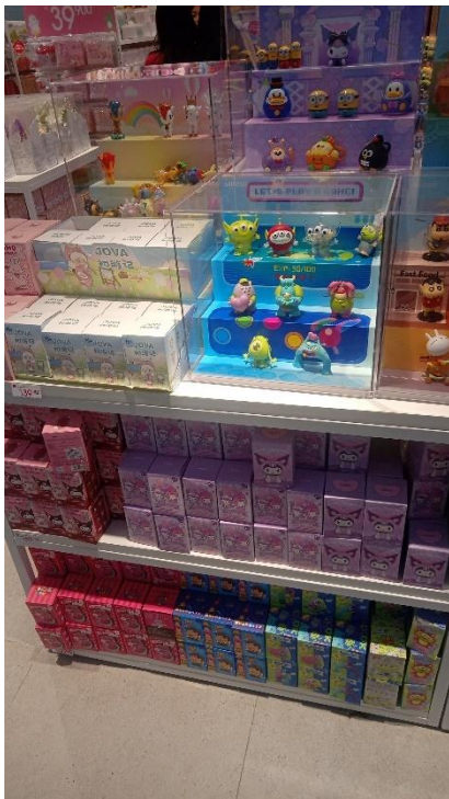
Gambar 8: Blind box dan display