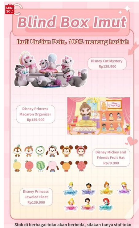
Gambar 9: Promosi blind box