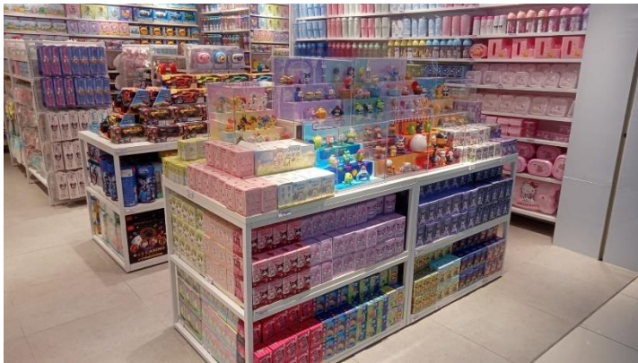
Gambar 2: Produk Blind Box