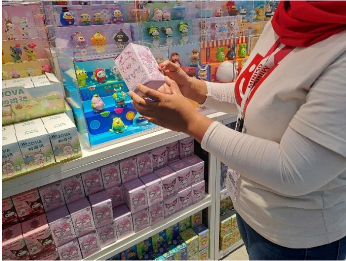
Gambar 1: Produk Blind Box