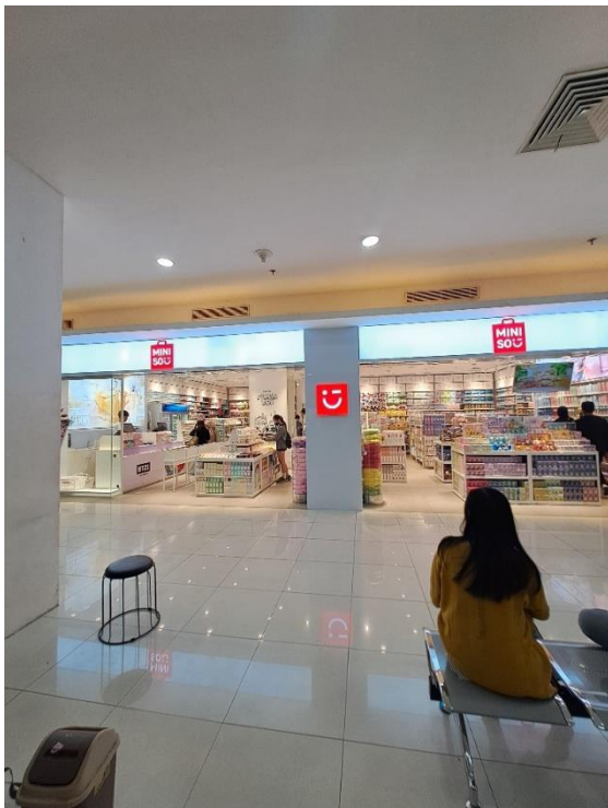
Gambar 3: Miniso Kediri Town Square