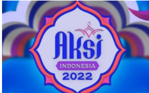
Gambar 3.1 Logo AKSI Indosiar

Indosiar adalah salah satu stasiun televisi yang menghadirkan program yang berkualitas untuk memberikan siraman rohani. Program ini dapat dilihat pada bulan Ramadhan saat umat muslim membutuhkan wadah untuk menyampaikan dakwah islam yang disebut dengan program AKSI (Akademi Sahur Indonesia). Ini adalah program pencarian bakat dalam dakwah islam atau ceramah dengan tujuan untuk mencari pembicara baru yang memiliki karakter khas dan berkualitas dalam hal berpidato. Untuk mencapai hal tersebut, programmer dan tim redaksi stasiun televisi di Indonesia harus membuat suatu program yang menarik dan mudah diterima oleh audiens , serta sesuai dengan Pedoman Perilaku Penyiaran dan Standar Program Siaran (P3 dan SPS).