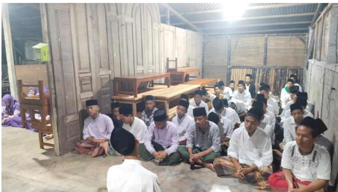
Kegiatan rutin pembacaan tahlil dan yasin bersama tiap malam jum'at