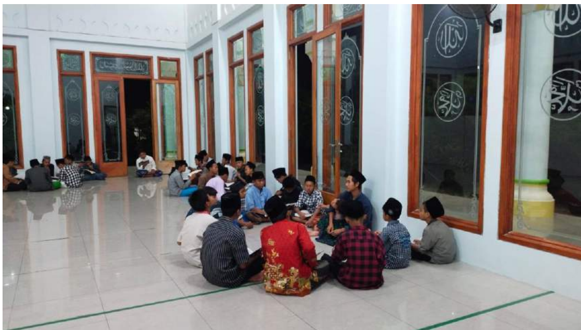
Kegiatan Tadarus al-Qur'an bakda Maghrib membentuk halaqoh sesuai kelompok