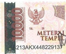
Nur Khosiatus Zaida