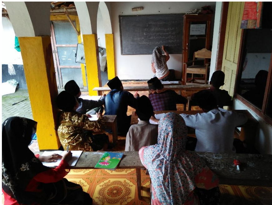
Proses pembelajaran Madrasah diniyah Darussalam