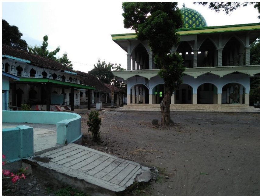
Nampak dari Luar