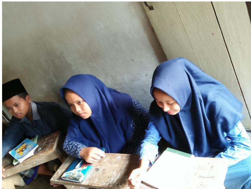
Ruang Kelas Tingkatan Tertinggi