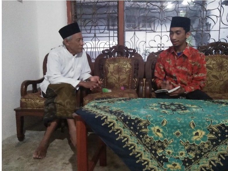
GAMBAR 1.8 Wawancara dengan Wali Murid dan Siswa Terbaik Mtsn 17 Jombang Kelas 8