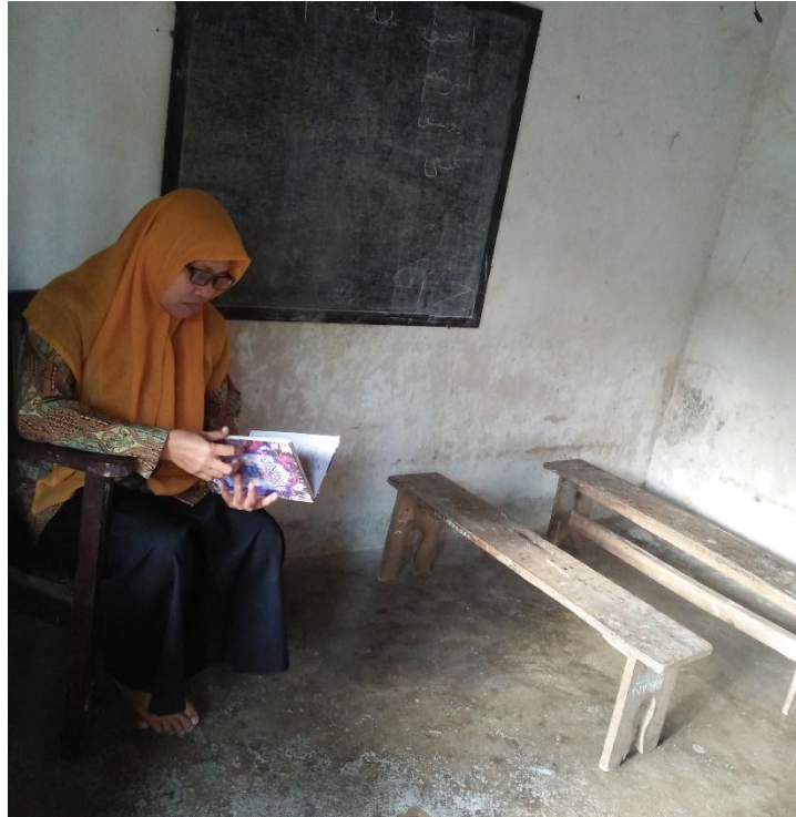
GAMBAR 2.1 Wawancara Dengan Tokoh Agama