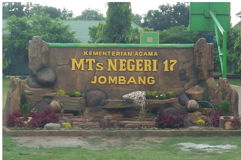
Nampak dari Luar