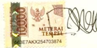
DHIKY BAGUS SAPUTRO