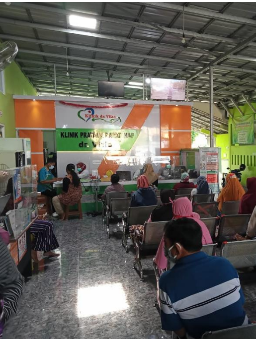
Bagian depan loket Klinik dr. Vitis