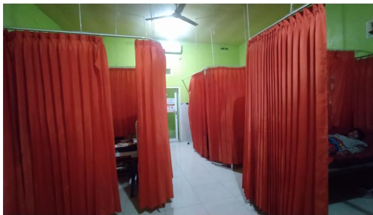
Ruang Rawat Inap