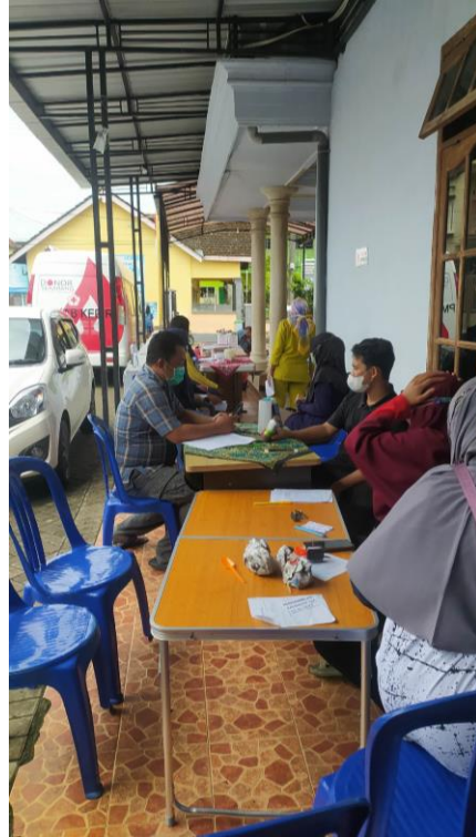
Kegiatan Donor Darah