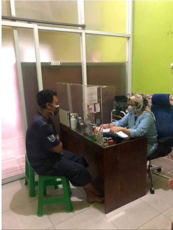
Kegiatan Poli Umum