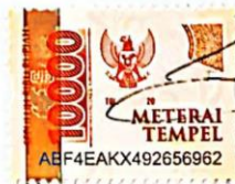
Arvin Khoirul Bunayya

Kediri, 13 Januari 2023 Yang membuat pernyataan