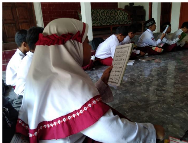
Gambar 5 : Kegiatan Dril “latihan” mengulang bacaan yang ada dibuku pegangan Metode Ummi yang dilakukan secara individu