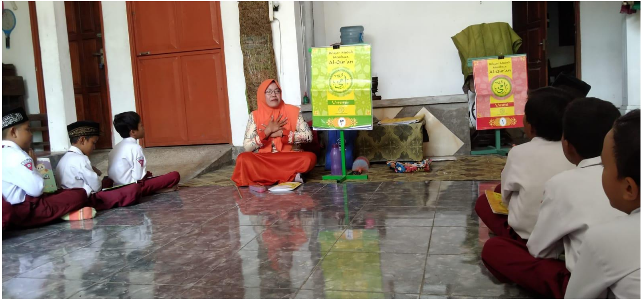
Gambar 3 : Kegiatan Pembukaan Materi Metode Ummi di Kelas 3