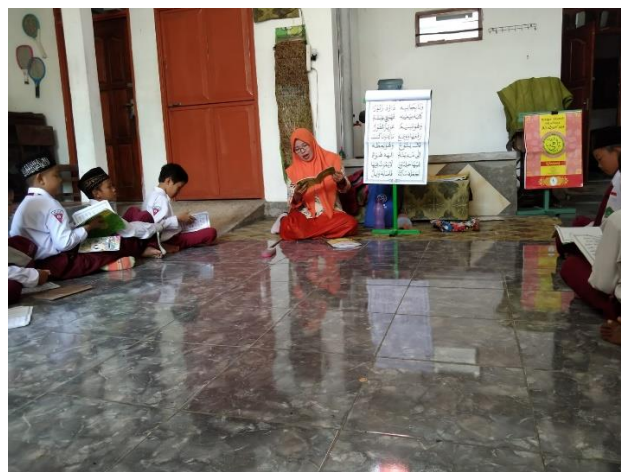
Gambar 4 : Kegiatan mengulang pemahaman materi secara internal siswa di kelas 3