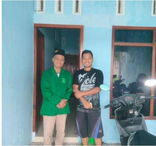
Gambar 2 :Foto Dokumentasi dengan pemilik kamar kos B