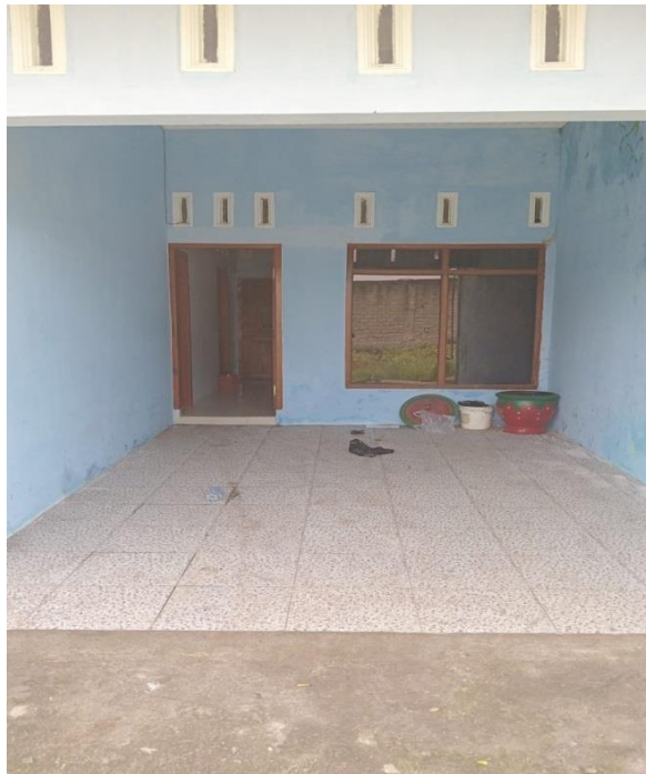
Gambar 6 :Foto Dokumentasi rumah kos B