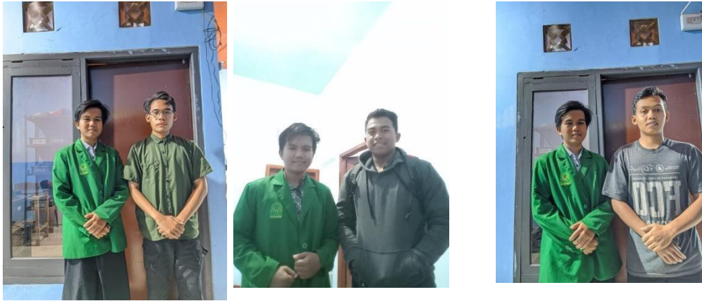
Gambar 4 :Foto Dokumentasi dengan penyewa kamar kos B