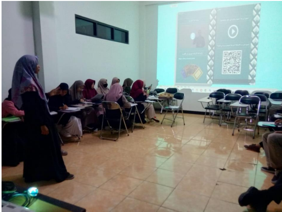
Foto Kegiatan Uji Coba e-Modul TAM pada Mahasiswa