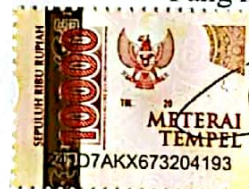
NUR ISNAINI AZIZAH