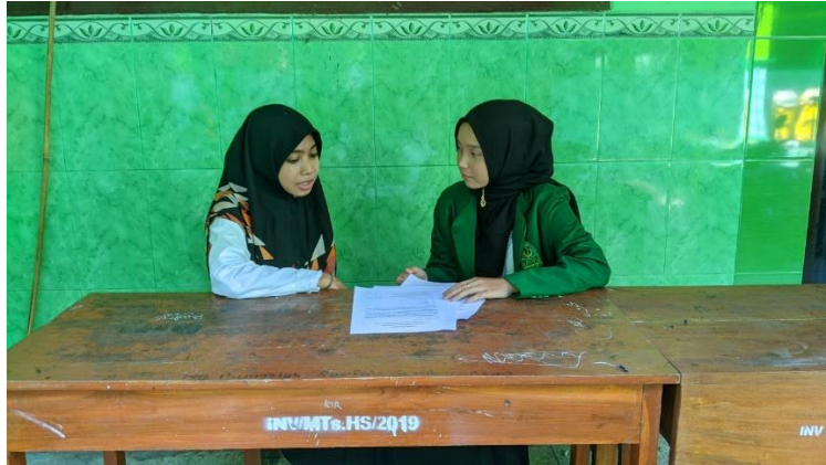
Wawancara dengan Guru Bahasa Arab