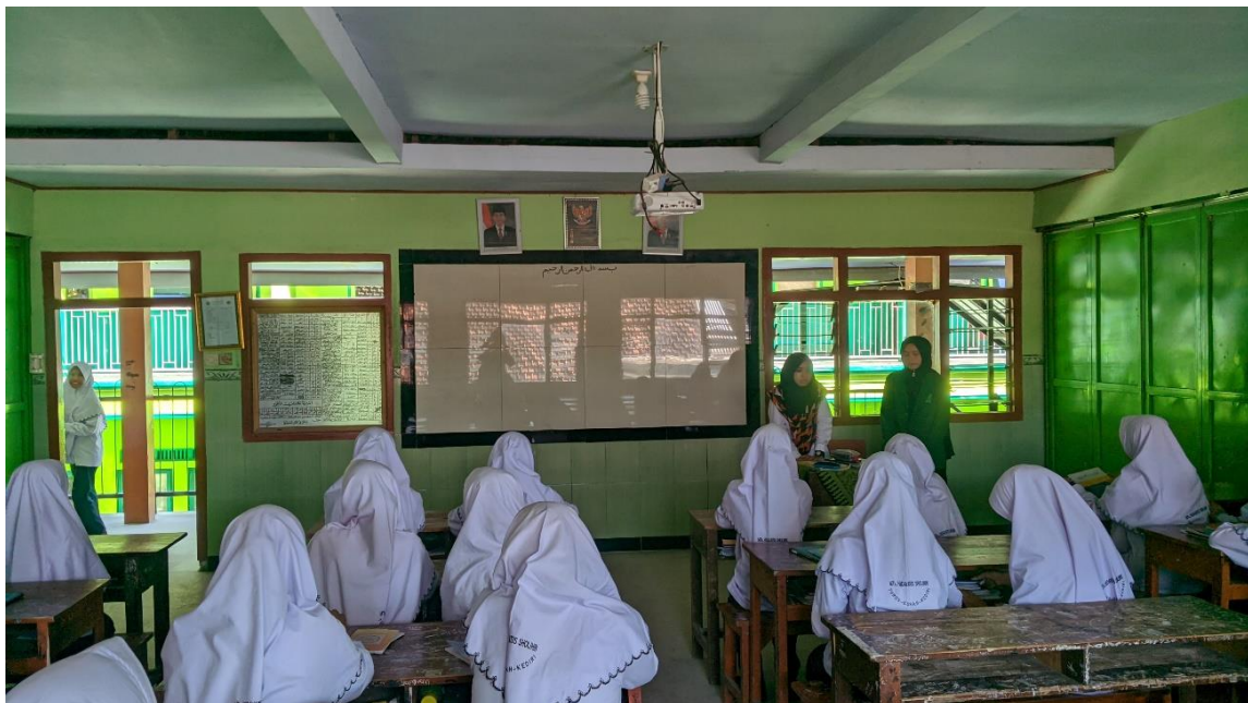
Dokumentasi Proses Pembelajaran