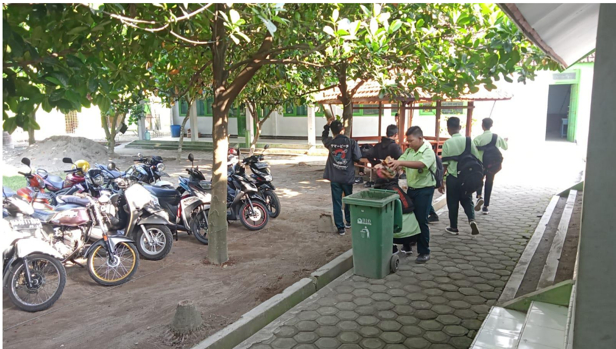
Anak anak membuang sampah pada tempatnya