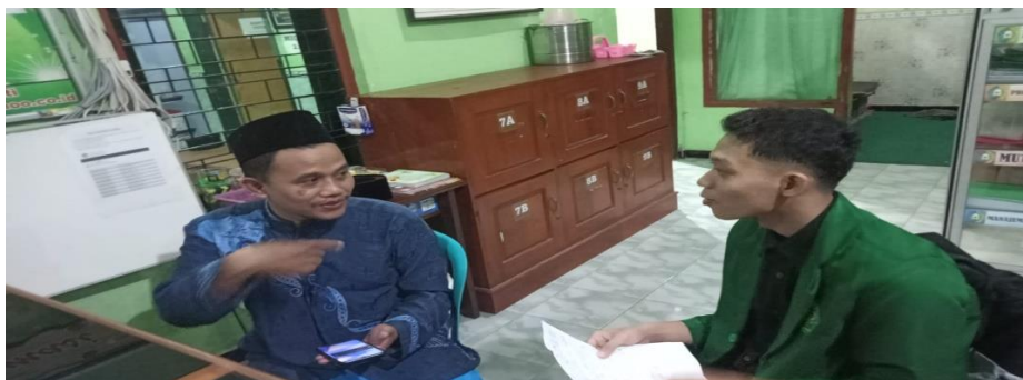
Wawancara dengan guru akidah akhlak