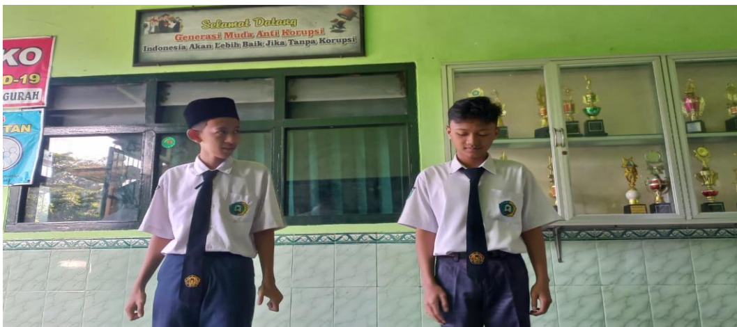
Anak anak menerima hukuman disiplin