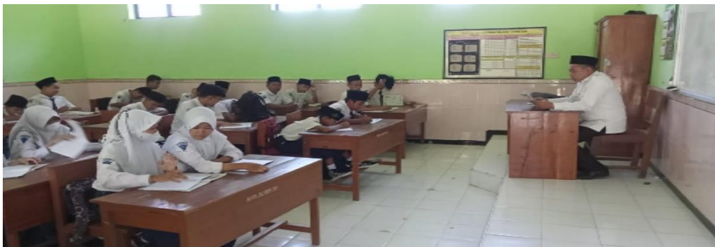
Suasana ruang kelas