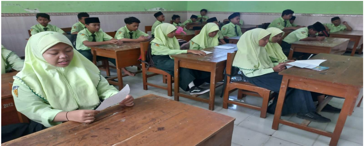
Kondisi anak anak di kelas