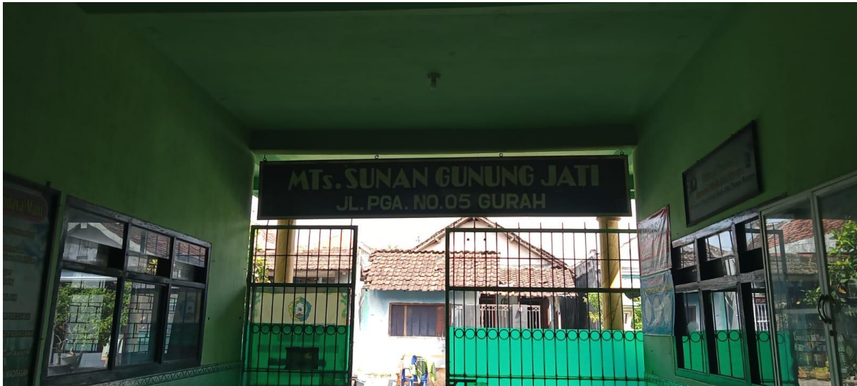
Dokumentasi depan Madrasah