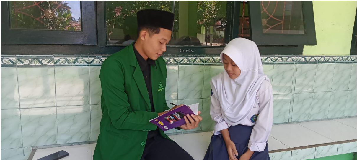
Wawancara dengan ajeng