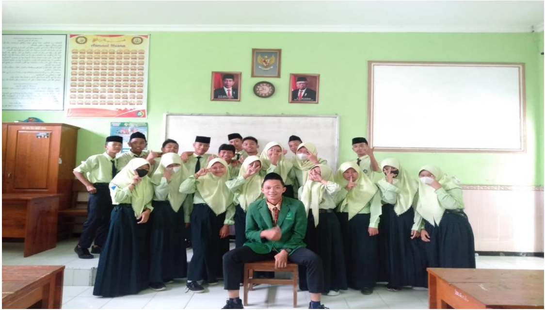
Foto bersama anak anak