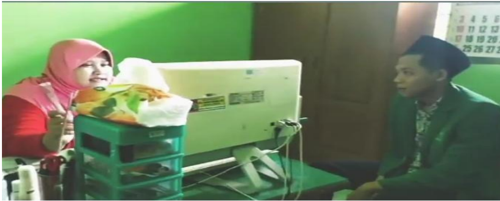
Wawancara dengan bu Husnul waka kurikulum