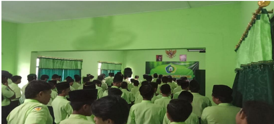
Kegiatan sholat berjamaah