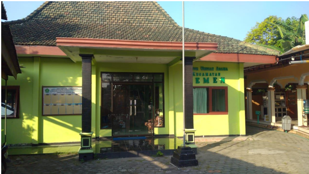
Foto Dokumentasi II. Foto KUA Semen