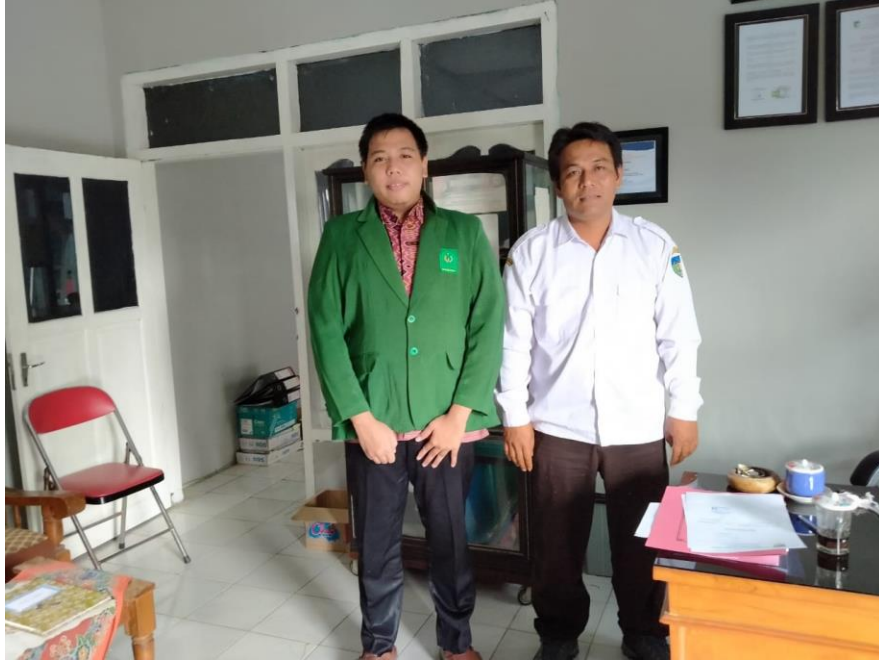
Foto Dokumentasi I. Foto dengan Bapak Kepala Desa Puhsarang