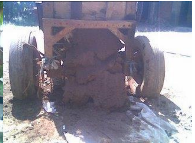
Tanah yang keluar dari penggilingan