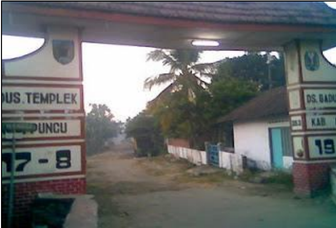
Templek pengrajin genteng