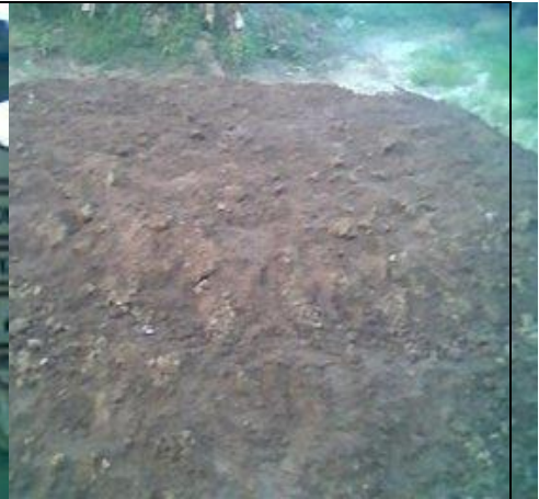
Tanah mentah/ bahan baku